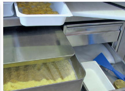
Contenitore farina e cassettera Container for flour and chest

Soluzione brevettata consigliata per piccoli Pastifici, Supermercati, Ristoranti, Agriturismi e Gastronomie. Patented solution, the most useful for Pasta Shops, Restaurants, Supermarkets, Farm Holidays and Delicatessens.