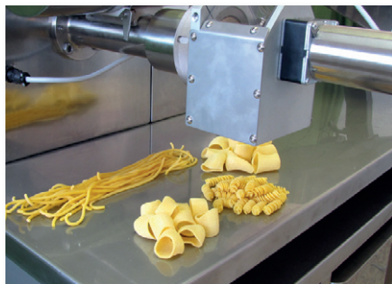
Gruppo di taglio paste corte Cutter group for short cuts