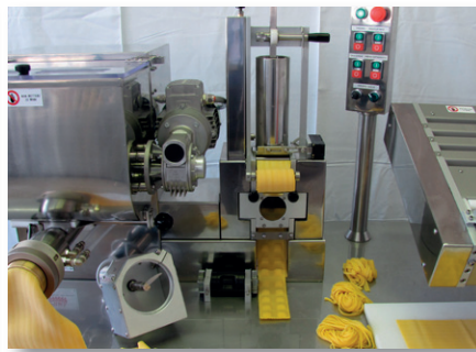
Raviolatrice Ravioli machine