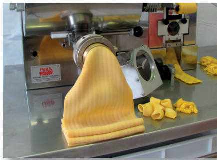
Pressa impastatrice Extruder pasta machine