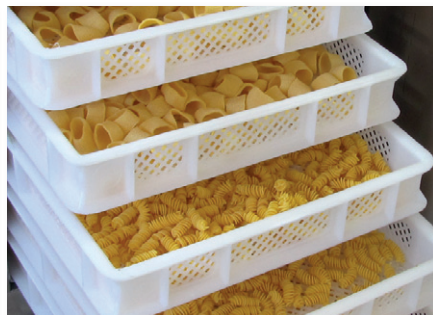
Asciugatoio 7 telai Drier with 7 frames